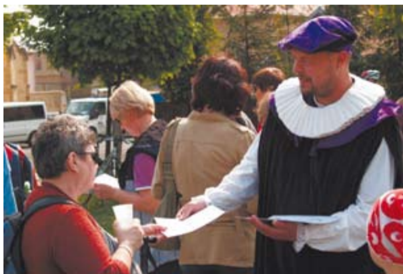
Centrum rozvoje turismu se snaží zlepšit image regionu. Při tom mu pomáhá i maskot cestovního ruchu na Mostecku, kterým byl zvolen Magistr Kelley.

Jedním z důvodů, proč Centrum rozvoje turismu Mostecka původně vzniklo jako příspěvková