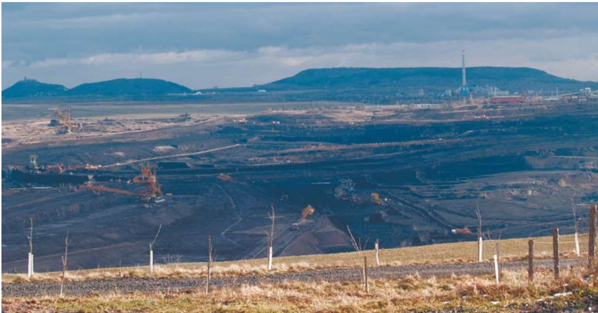
Většina fotografií lokality Československá armáda Litvínovské uhelné zachycuje lom z pohledu proti Krušným horám. Ačkoli tato fotografie vypadá, jako kdyby byla pořízena na jaře, opak je pravdou. Jedná se o aktuální snímek lokality ČSA ze směru od Krušných hor.