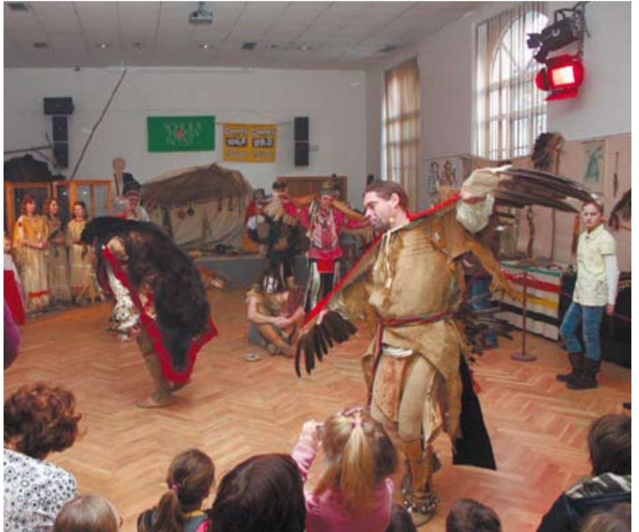
Součástí výstavy jsou i vystoupení, která ukazují například výjevy ze života indiánů.