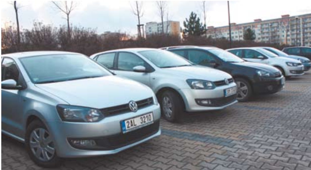
Společnost Servis Leasing provozuje pro skupinu Czech Coal mimo jiné v Mostě autopůjčovnu.