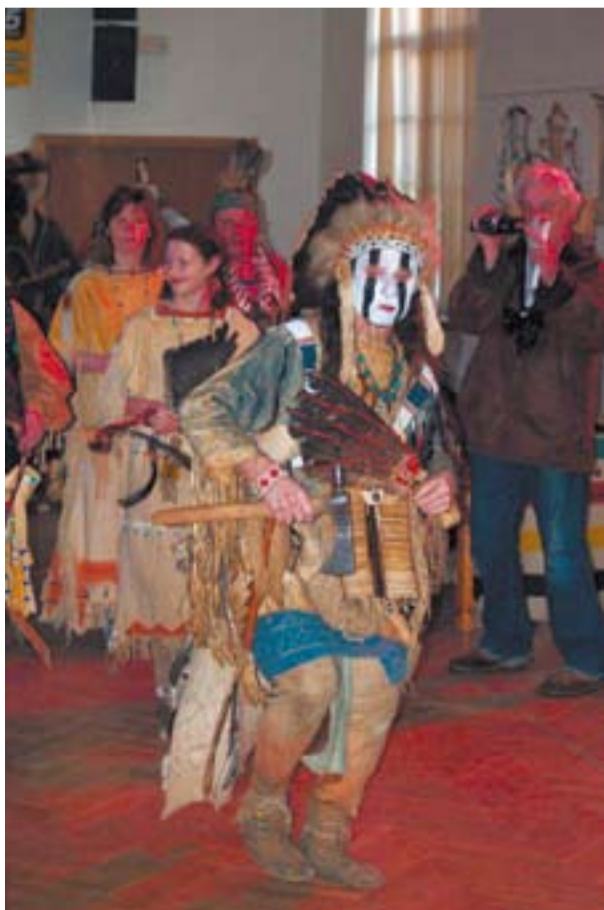
Nechybí tradiční indiánské tance, které mají svá přísná pravidla.