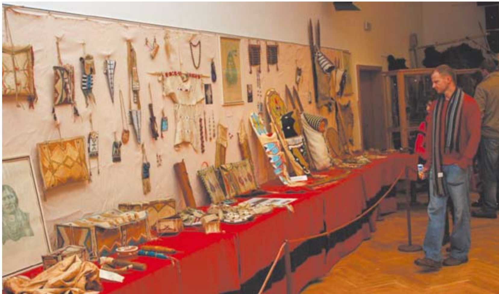
Indiánská výstava se neustále rozšiřuje a doplňuje o nové exponáty.

Litvínovští skauti se pravidelně účastní také Svojsíkova závodu, soutěže určené pro hlídky z celé České republiky. Asi největšího úspěchu dosáhli před dvěma lety, když starší skauti vyhráli celostátní kolo Svojsíkova závodu a mladší – vlčata skončili sedmí v republice. Také díky tomuto úspěchu vyvrcholí letošní ročník Svojsíkova závodu na Mostecku. Organizačně ho budou zajišťovat litvínovští a mostečtí skauti. Hlídky z celé republiky se do regionu sjedou v září. (red)