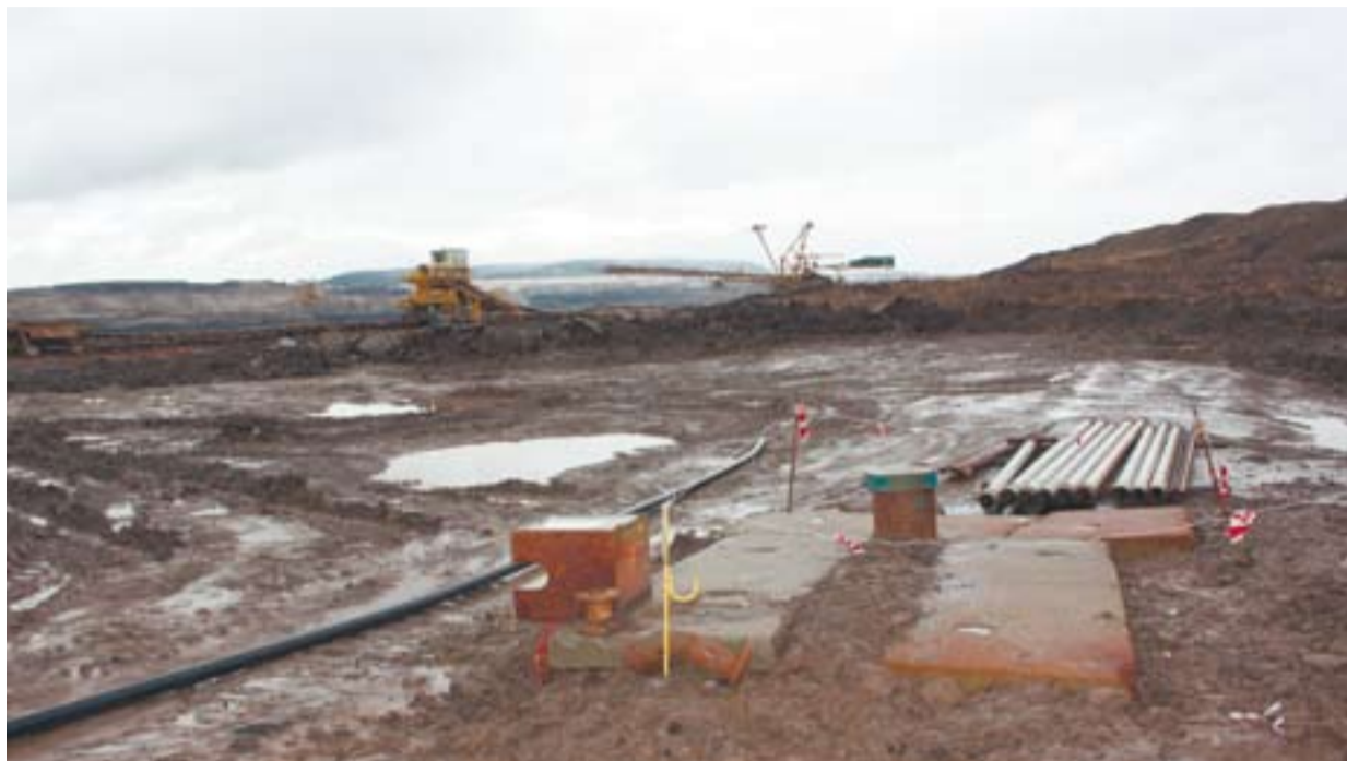
Hydrogeologický čerpací vrt STE 790/6 na lokalitě Vršany (na snímku) bude během letošního roku v souvislosti s postupem zakládání zlikvidován. Nahradí ho zcela nový odvodňovací vrt STE 792/8 v prostoru poháněcí stanice č. 127, který by měl díky svým parametrům vydržet déle.

Vrtu se v těžební lokalitě Šverma-Vršany využívají k odvodňování kolektoru podloží písků, aby byl zajištěn bezpečný postup těžby lomu na spodních uhelných řezech.