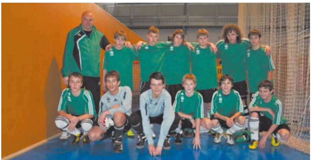
Vítězný tým FK Baník Most.