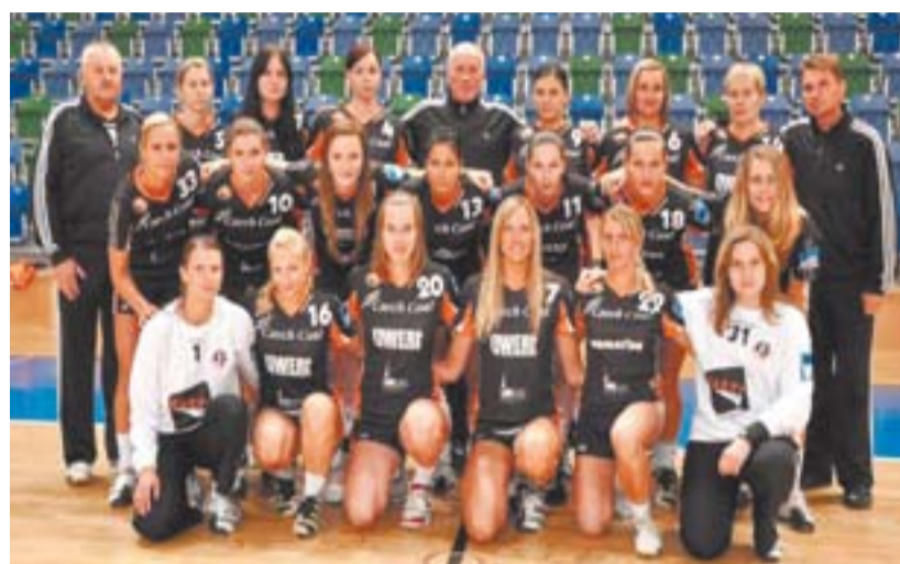
Házenkářky zvou 28. ledna od 17.00 hodin na mistrovské utkání házené žen DHK Baník Most – TJ Házená Jindřichův Hradec.

Most – Zora Olomouc 26:23, Most – Slávia Praha 24:18 a Most – Veselí nad Moravou 27:24. (eš)