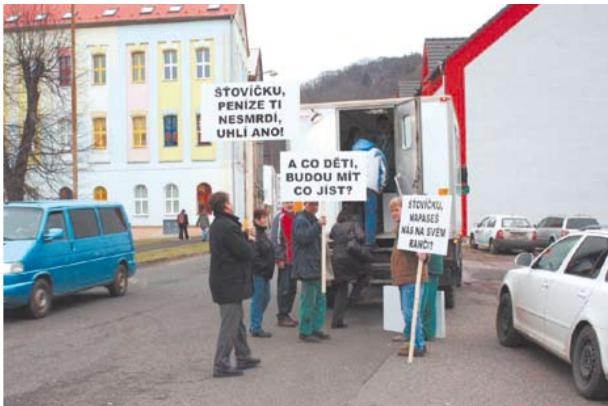
Odboráři skupiny Czech Coal odjíždějí od litvínovské Scholy Humanitas poté, co se dozvěděli, že jednání výboru pro životní prostředí Poslanecké sněmovny Parlamentu ČR v Litvínově bylo zrušeno. Svůj účel ale podle jejich zástupců shromáždění splnilo, vyjádřili svůj názor a poukázali na fakt, že lidé v regionu vnímají problematiku limitů těžby i jinak, než jak ji prezentuje starosta Litvínova.