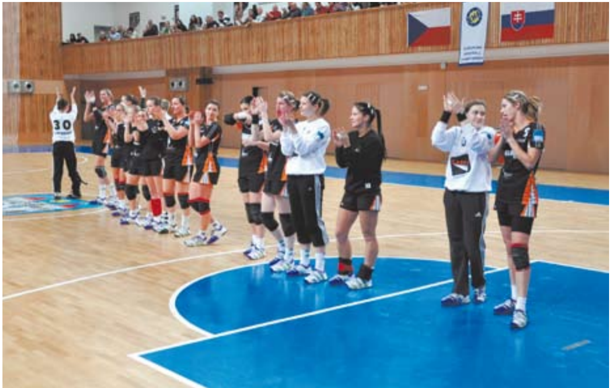
Házenkářky Baníku Most DHK po utkání s Veselím.

O víkendu se opět hraje další kolo turnaje Apollo Cup 2012. Sobota 28. ledna - Elite: 10.30 hodin Havran Kryry - Lok. Chomutov, 12.30 Slavoj Žatec - FK Louny, 14.30 TJ Sokol Horní Jiřetín - SK Strupčice, 16.30 FK Baník Souš - FK Bílina, 18.30 FK Baník Most U19 - Tatran Kadaň. Neděle 29. ledna - Premium: 10.30 hodin SK Kopisty - SFK Meziboří, 12.30 Sokol Obrnice - SK Viktoria Lom, 14.30 TJ Baník Březenecká CV - FK Havraň. (eš)