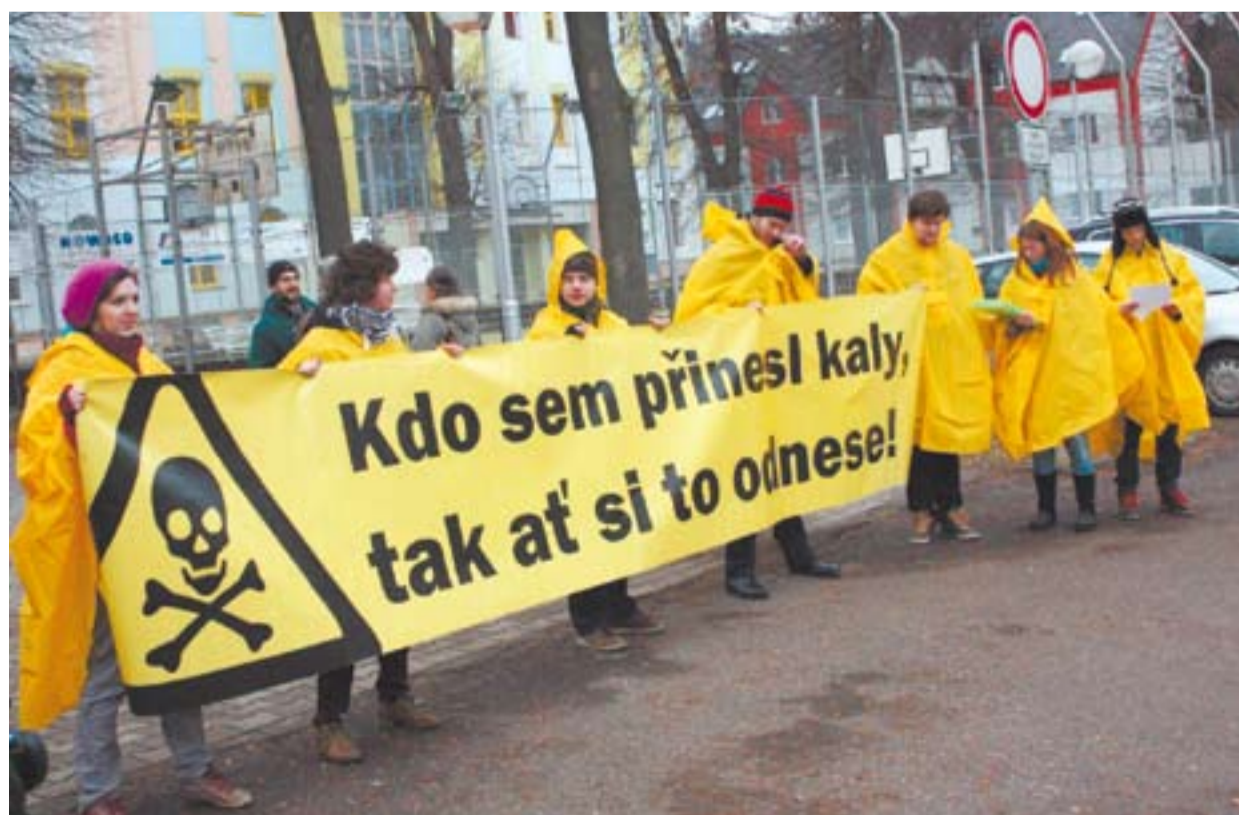
Demonstrovat před Scholou Humanitas přišli i zástupci hnutí Kdo za to může, kteří vyjádřili nesouhlas s postupem města, jež podle nich dostatečně nebránilo a nehájilo zájmy zdejších obyvatel při dovážení kalů z ostravských ropných lagun na Mostecko a uložení na skládku Celio.