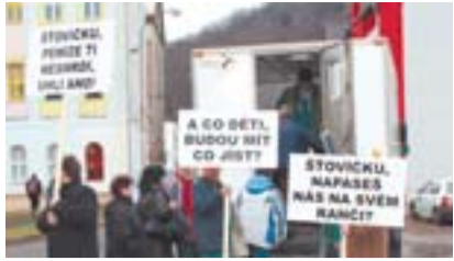
Odboráři Czech Coal demonstrovali v Litvínově – str.11