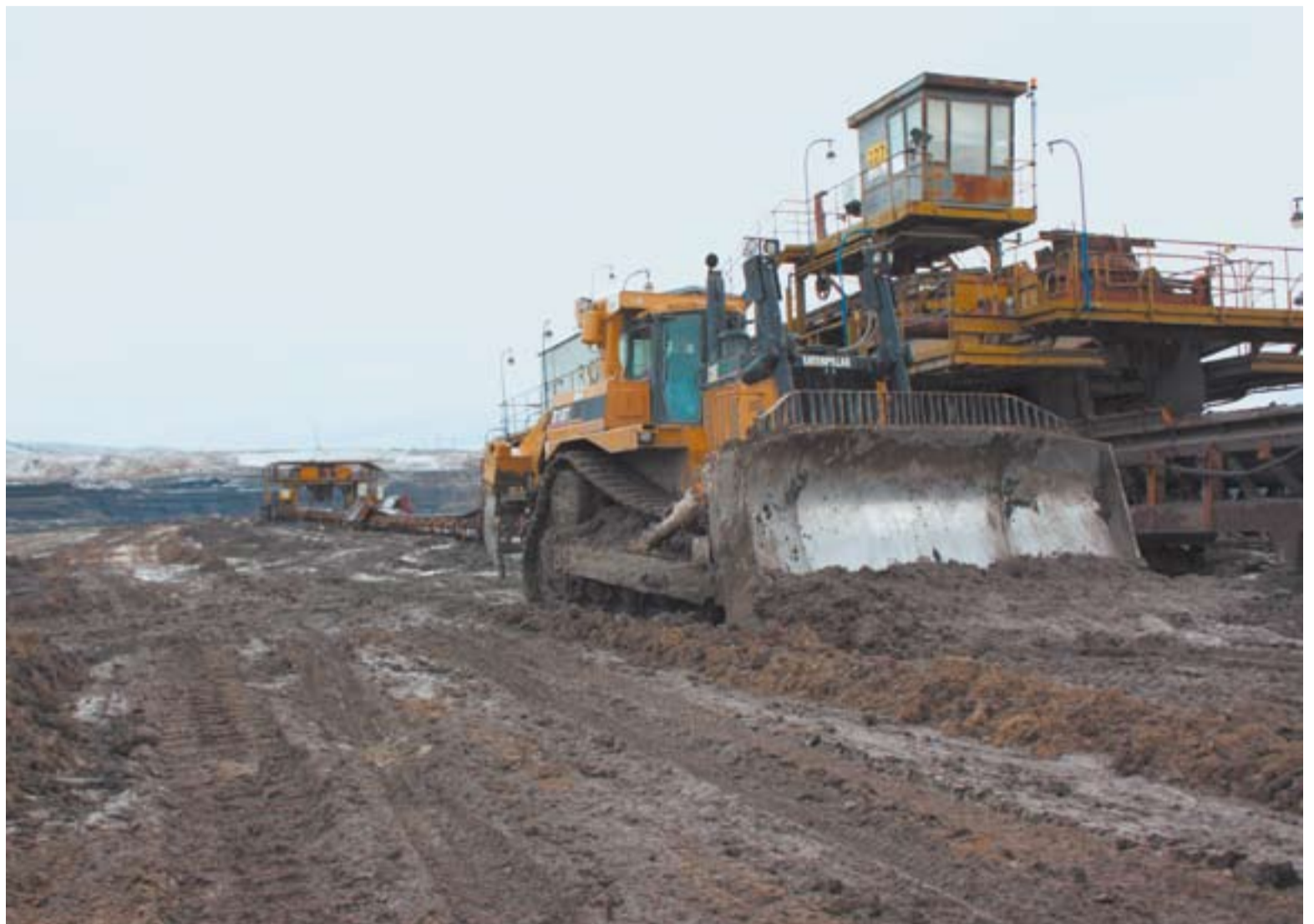
Současná zima sice několikrát naznačila, jak by mohla vypadat, ale zatím ani u sněhové pokrývky, ani u teplot pod bodem mrazu nezůstalo. Proměnlivé povětrnostní podmínky komplikují práci hlavně v těžebních provozech, velké nároky jsou kladeny hlavně na techniku při údržbě komunikací. Ne nadarmo se v těžebních provozech odedávna říká, že mráz je nejlepší cestář. Za současné situace je tak zapotřebí využít těžkou techniku, jak dokazuje náš snímek z lokality Vršany.