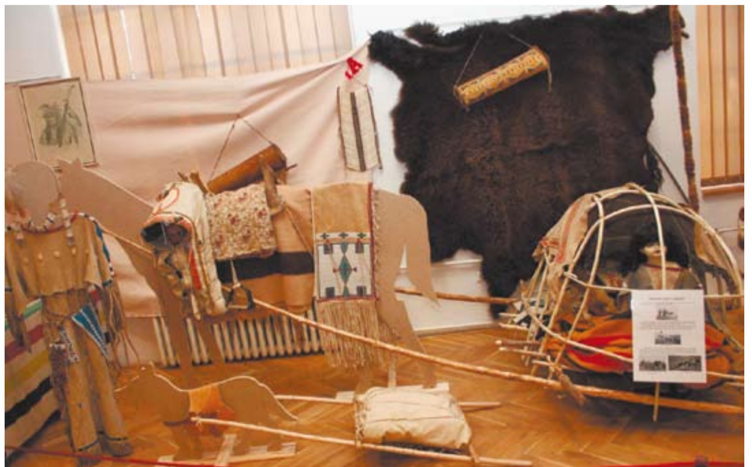
Mezi exponáty letos přibýla tématika dopravy.