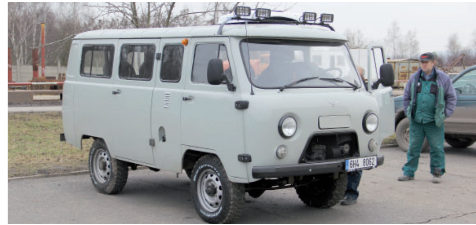
Ruský UAZ 2206 pojme celkem devět pasažérů, je tedy ideální pro rozvoz zaměstnanců na pracoviště.

Vycházeli jsme hlavně z usnesení vlády ČR, která na říjnovém výjezdním zasedání v Ústeckém kraji přijala usnesení, že připraví program pro propuštěné zaměstnance z lomu ČSA. Bohužel, my jako odbor slíbila, že udělá maximum pro to, aby ve spolupráci s úřadem