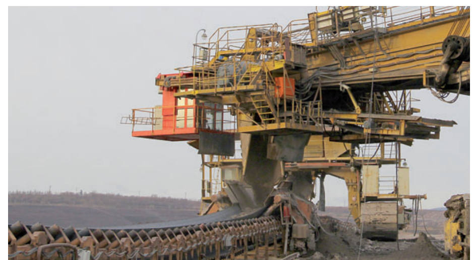
Takhle vypadá klapka skryvkového velkostroje, klapkař sedí v červené kabině nad pásovým dopravníkem.

riál lépe vysypal. A při zavírání této spodní části lopaty vždy následovalo charakteristické klapnutí, které bylo slyšet i velmi daleko. Odtud tedy pochází ona klapka. Název ale nezánikl ani s příchodem kolesových rýpadel. Klapání bylo slyšet dál, byť trochu jiné, při sypání materiálu do železničních vagonů. Dnes, když už uhlí putuje ve valné většině po pásových dopravnících, už sice charakteristický zvuk zmizel, klapkaři ale zůstali. A stejně jako před léty mají za úkol hlídat, aby materiál z „bagru“ padal tam, kam má. (red)