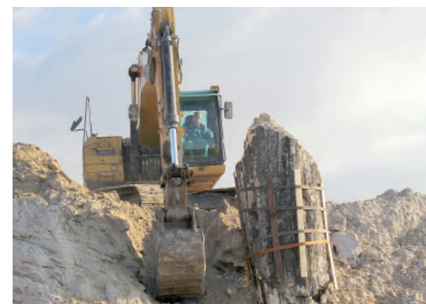
Takhle se vloni na podzim připravoval strom k převozu do ústeckého muzea.

Do ústeckého muzea míří minerály Mostecké pánve. Základ výstavy tvoří makrofotografie Petra Fuchse, které pod stejným názvem mohli vidět vloni návštěvníci Oblastního muzea v Mostě. Fotografie ale budou doplněny o vitríny se vzorky typických minerálů, nalezených při těžbě hnědého uhlí. Právě v Muzeu města Ústí nad Labem je totiž uložena druhá největší sbírka minerálů z oblasti mostecké pánve. Vůbec poprvé si tu bude veřejnost moci prohlédnout i menší části fosilního kmene, který byl objeven vloni ve Vršanské uhelné. (red)