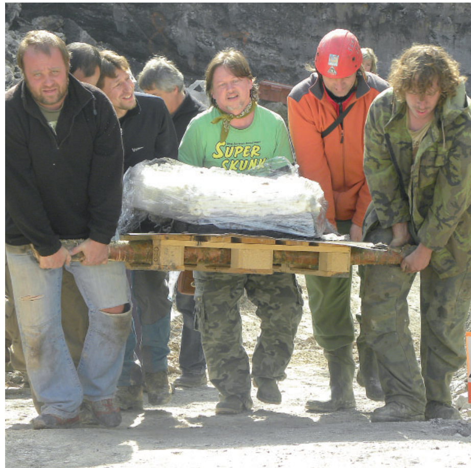
Vynést některé nálezy dalo výzkumníkům občas i dost zabrat.

V roce 2013 byla u Nýřan na lokalitě „Doubrava 1“ odhalena a paleontologickými metodami prozkoumána vrstva tufu na ploše 48 metrů čtverečních v hloubce sedmi metrů. Vrstva obsahovala několik velkých kusů rostlin stromovitěho vzrůstu a velké množství drobnějších zbytků rostlin. Celkem čítá preparace výzkumníkům podařilo odhalit více než 3800 drobných vzorků fosílií. Nálezy představují