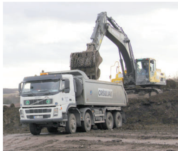
Odtěžit je tu třeba přes 700 tisíc kubiků zeminy.

no jiné odtěžení zhruba 700 tisíc kubiků zeminy,“ sdělil Radek Vitvar, specialista projektu výstavby inženýrských sítí Hořanského koridoru. Práce by tu měly probíhat nepřetržitě celou zimu s předpokládáním ukončením v roce 2017. Plynule na ně pak navážou další etapy, které mají definitivně připravit území pro novou trasu produktovodů. Zemní práce ale nejsou jedinými, které v Hořanském koridoru v současnosti probíhají. Pokračuje se například se sanacemi starých důlních děl, v přípravě i realizaci dalších přeložek linek vysokého napětí a celé řadě dalších činností. (red)