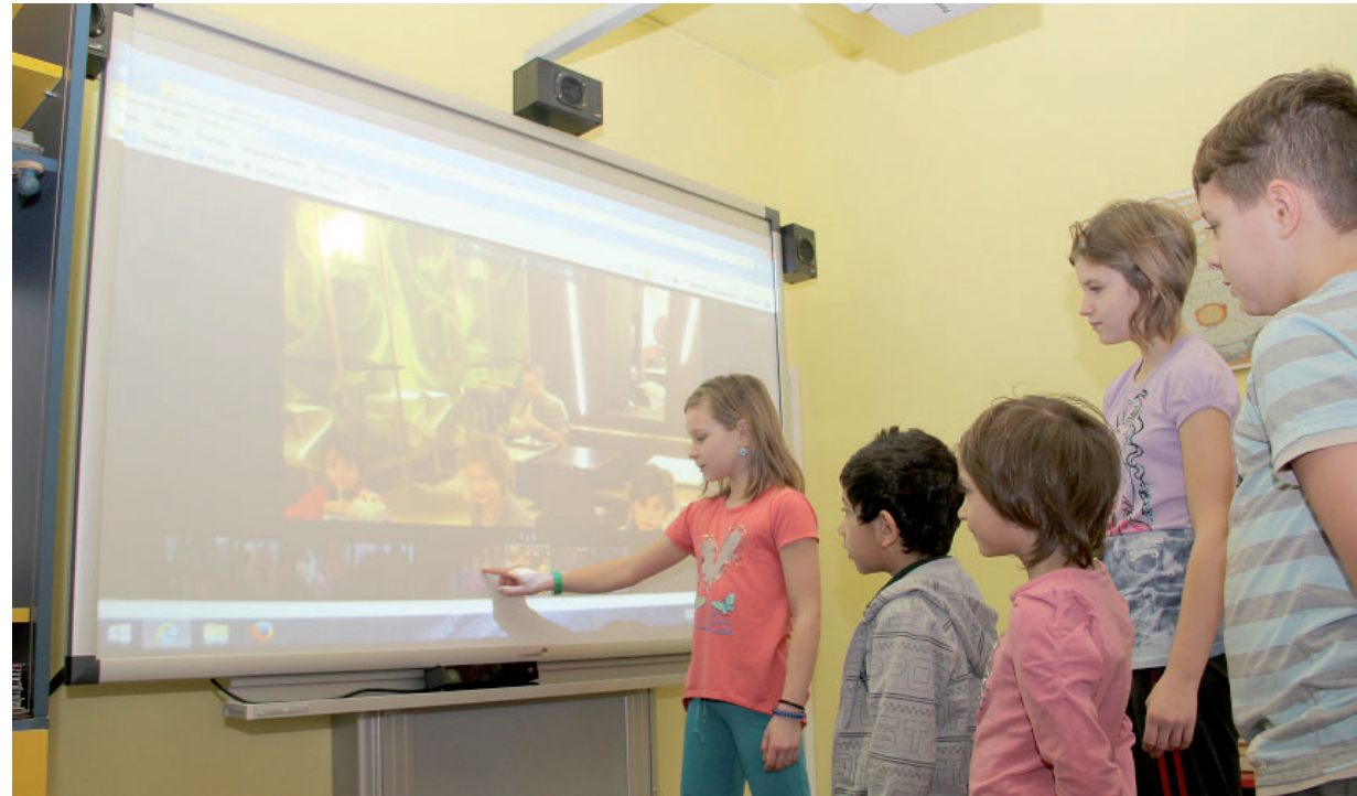
Interaktivní tabule může sloužit i pro prohlížení fotografií z výletů.

Děti se na ní nejen učí, ale díky tomuto zařízení třeba cvičí, tancují, hrají hry nebo si mohou prohlížet fotografie z akcí, které v loňském roce navštívily (na snímku). S dětským domovem těžební společnost spolupracuje dlouhodobě, stalo se již tradicí, že na každoročním předvánočním setkání dětí zaměstnanců společností skupiny Czech Coal s Barborkou a Prokypkem jsou předávány i šeky právě mosteckému dětskému domovu a kojeneckému ústavu. Vloni začátkem prosince obě instituce získaly po 50 tisících korunách, a zatímco v kojeneckém ústavu prostředky využijí na ozdravné pobyty dětí, dětský domov tyto peníze použije na nákup vybavení do bytů dětí. (red)