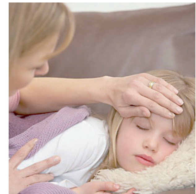
Ošetřovné využijí například rodiče, kterým onemocní potomek.

O dávku ošetřovného žádejte u svého zaměstnavatele prostřednictvím formuláře Rozhodnutí o potřebě ošetřování, vystaví vám ho ošetřující lékař. Později ještě dodáte Potvrzení o ukončení potřeby ošetřování, opět vydané lékařem. Když potřebujete pečovat o dítě kvůli uzavření školy či školky, budete potřebovat formulář Žádost o ošetřovné při péči o dítě do 10 let z důvodu uzavření výchovného zařízení (školy). Poskytnou vám ho ve škole nebo předškolním zařízení. Dávku následně vyplácí okresní správa sociálního zabezpečení.