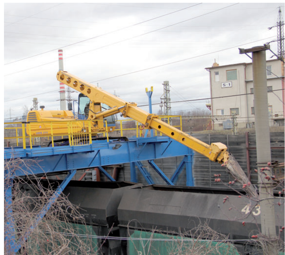
Čistička talbotových souprav funguje nedaleko hradla Š1 už desítky let.

je k dispozici a jehož pomocí ovládá pohyb celé vlakové soupravy. „V minulosti musel komunikovat se strojevedoucím prostřednictvím signální zvonky a pohyb soupravy nemusel být vždy zcela přesný. Dnes už si obsluha čističky může vagonu pod sebou nastavit přesně, jak potřebuje. (red)