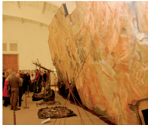
Výstava dominuje kopie známé skalní obrazárny Oenpelli o úctyhodných rozměrech 12 x 6 metrů.

by v současné době nebylo možné. K vidění jsou autentické umělecké předměty, řada z nich je zdobená tradičními malbami, od schránek na uložení kosterních pozůstatků, přes domorodé hudební nástroje, známé pod názvem didgeridoo, až po rituální vesla. Cenný je také model chaty s originálními malbami na kůře. Málokdy také mají lidé šanci si prohlédnout skutečné lovecké zbraně nebo třeba předměty denní potřeby kmeny Rembarranga. Součástí výstavy jsou kopie zobrazení mytických duchů i zvířat, všemu pak dominuje kopie známé skalní obrazárny Oenpelli, která má úctyhodné rozměry 12 x 6 metrů. (red)