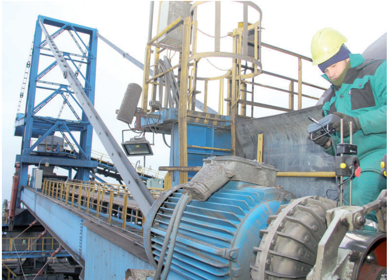
Během plánované odstávky se provádí například diagnostika pohonu kola skládkového stroje na úseku uhlí Vršanské uhelné.