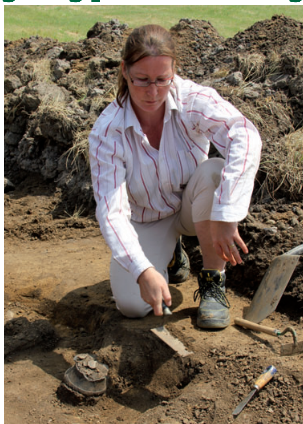
Archeologové odkrývají jeden ze dvou více než čtyři tisíce let starých hrobů, které našli ve Slatinicích.