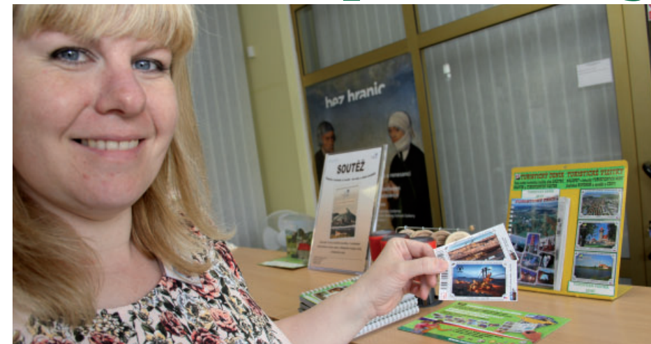
Turistické známky Uhelného safari jsou k dispozici zájemcům v informačních centrech v Mostě i Litvínově.

klad autodrom, Podkrušnohorské technické muzeum, lázně v Teplicích, děčínská ZOO nebo Muzeum kuku a lihu Dobrovice a park miniatur Klein-Erzgebirge Oederan. Zastoupení na veletrhu měla i Destinační agentura Krušné hory, která představila i nové brožury pro turisty, jež vznikly ve spolupráci s těžebními společnostmi Seven a Vršanská. Mostecké turistické informační centrum, které patří mezi pořadatele miniveletrhu cestovního ruchu, pravidelně přidává ke své nabídce i informace o Uhelném safari jako jedné ze zajímavostí regionu. (red)