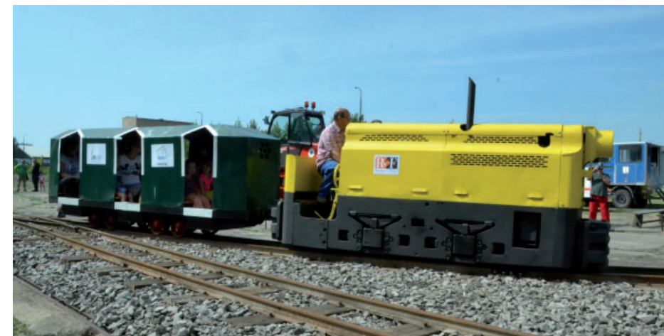
Zátěžovou zkouškou prošla úzkokolejka hned po slavnostním zprovoznění během oslav Dne dětí.

získalo z nedalekého, nedávno uzavřeného hlubinného dolu Centrum. Jedná se o důlní mašinu, která se běžně využívala ve většině hlubinných dolů. Zatím jediný vozík, který táhne, býval označován Pullman a pobeře celkem 12 dětí. Do budoucna by měl mít vláček tři vagony. Vozíky, které muzeum získalo ze severní Moravy, je však třeba ještě speciálně upravit. „Úmyslně jsme úzkokolejku chtěli slavnostně otevřít během našich tradičních oslav Dne dě-