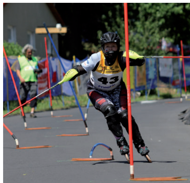
Do Vysoké Pece se sjela evropská špička inline slalomářů.

Jako každý rok tam jeden z průkopníků tohoto sportu u nás, Lyžařský klub Jirkov, pořádá závody Světového poháru. Původně letní příprava pro alpské lyžování se během let stala regulérním sportem, jen lyže nahradily kolečkové brusle. Závodí se na silnici místo sjezdovky, kde nahrazují klasické branky kloubové tyče připevněné k litinovým podstavcům. Disciplíny se ale od alpského lyžování příliš neliší, jezdí se slalom, obří slalom, paralelní slalom i týmové soutěže. Také letos dvoudenní klání podpořila Vršanská uhelná.