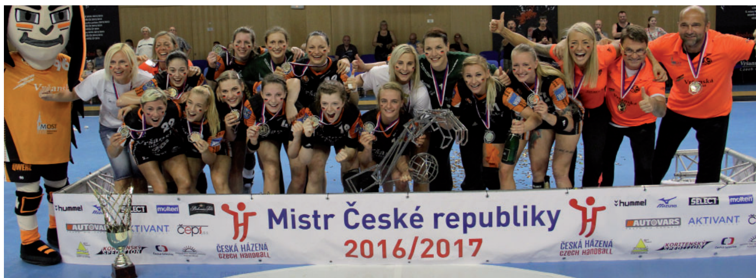
Kompletní mistrovský tým Černých andělů.