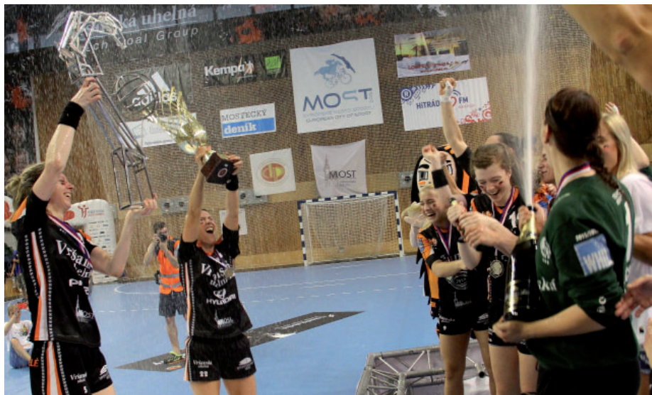
Takhle vypadá nefalšovaná mistrovská radost. Dvě domácí vítězství znamenala pro mostecké házenkářky zisk pátého českého titulu v řadě.

Házenkářky mosteckého DHK Baník Most si již užívají zaslouženého volna. Obhájily český titul. Ve finále se postavily proti stejnému soupeři jako loni. S pražskou Slavií sehrály dvě utkání. První souboj finálové série v Praze Černým andělům nevyšel, proto se před domácím publikem museli snažit, aby vítězství strhli na svou stranu. Předvedli se v tom nejlepší světle. Skvělá divácká kulisa a přesvědčivý výkon jim dopomohl k výhře nad silným soupeřem a pohár pro českého mitra tak zůstává i letos v Mostě.