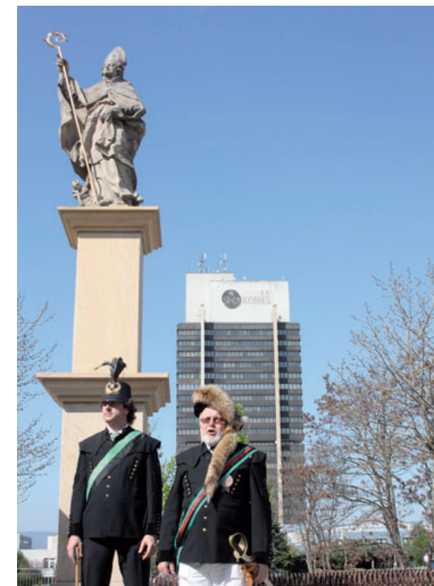
U sochy svatého Prokopa na druhém mosteckém náměstí se zastavuje i hornický průvod při tradičním Skoku přes kůzi.

Jako patron havířů začal Svatý Prokop postupně nahrazovat svatou Barboru od poloviny 19. století. Měl se stát ryze českým patronem a v postupně počestovaných uhelných revírech měl být tímto způsobem posílen národní duch. Podle některých zdrojů se prokopské oslavy ujaly i díky příznivému datu na začátku července, kdy se slavil i svátek Cyrila a Metoděje a obvykle se nepracovalo. Jinak ale hornické oslavy vypadaly podobně jako ty k uctění svaté Barbory. Ze šachet kráčely průvody uniformovaných horníků za doprovodu kapely, následovala mše a po ní zábava. Hornického patrona připomínají i v Mostě dvě sochy. Jedna od neznámého autora z roku 1723 stála původně v Souši, po několika stěhováních ji dnes najdete přímo v centru města mezi budovami kulturního domu Repre a finančního úřadu. Ani autor druhé sochy z roku 1738 není známý, pocházela z obce Vršany, od konce roku 2009 stojí na „náměstíčku“ v ulici Prokopa Holého ve čtvrti Zahražany. (red)