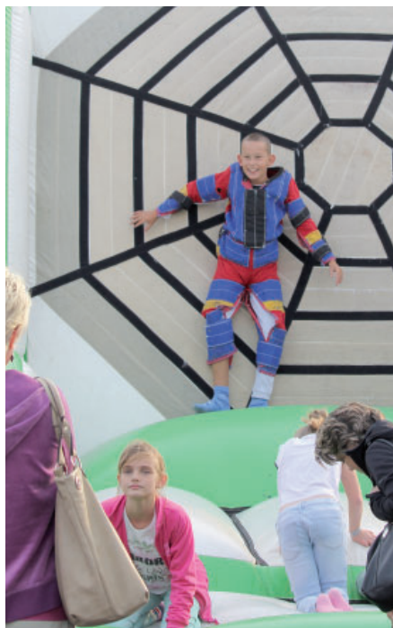
Hlavně děti si užívaly nové atrakce při hornické pouti.