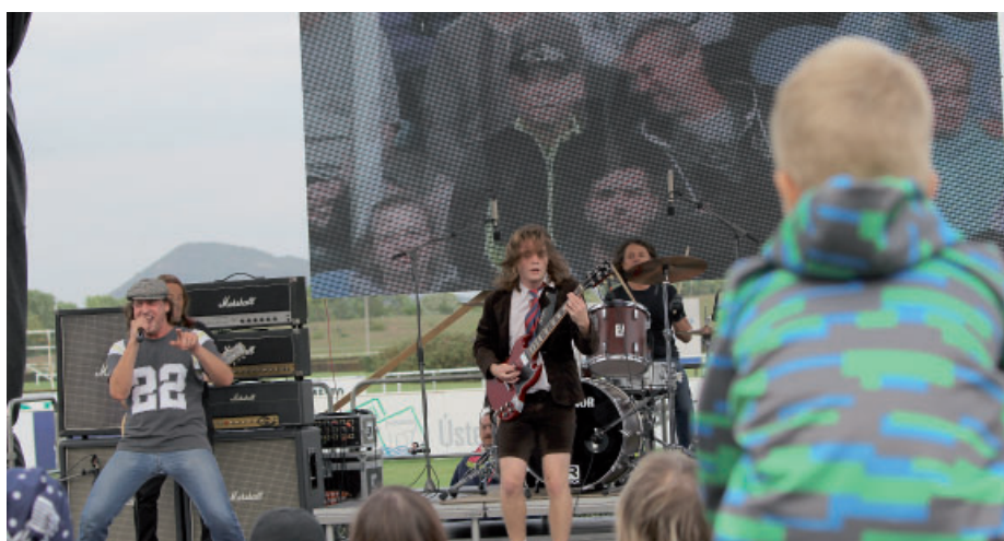
AC/DC Revival jakoby australským hardrockovým legendám z oka vypadli.