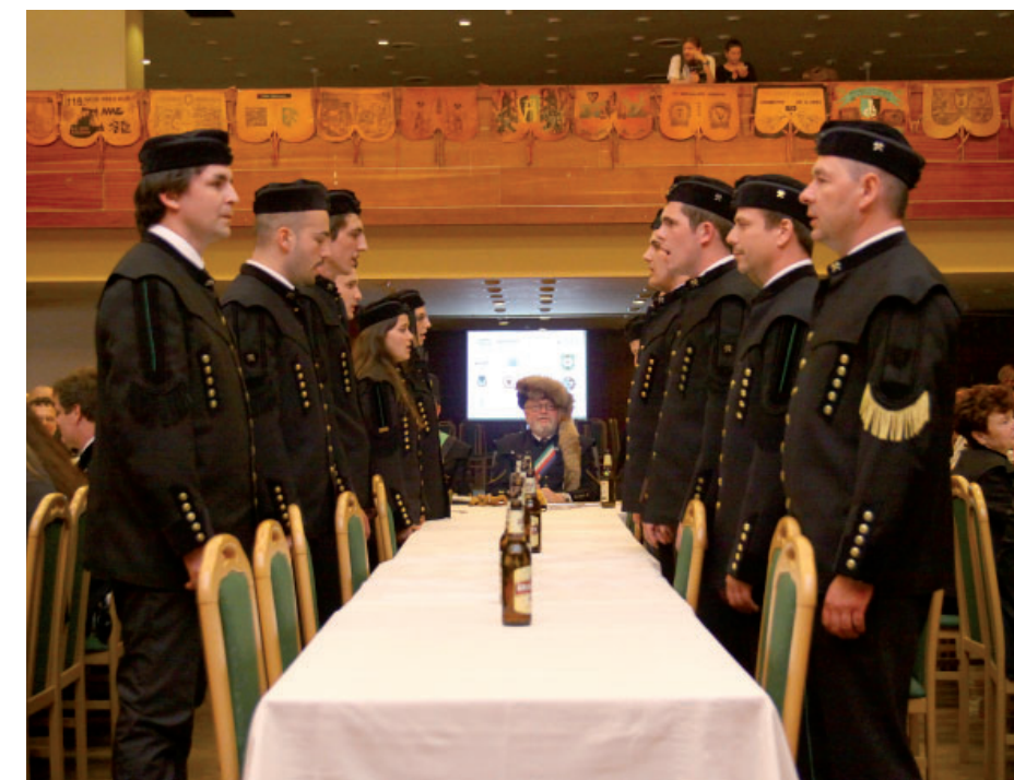
Skok přes kůži se letos opět uskuteční v mosteckém Repre.

A právě kulturní dům Repre se stane dějištěm samotného Skoku přes kůži, jako byl v minulosti už několikrát. Kromě „skokanů“ se zúčastní také nejvýznamnější osobnosti báňských institucí a hornických spolků a organizací, velmi často přijíždějí i havíři ze zahraničí. Celý večer se řídí přísnými pravidly Pivního zákona. Na jeho dozorování dohlíží PIPO – pivní policie, jejíž příslušníci jsou ze zákona odpovědní za včasnou a dostatečnou roznášku masti (piva) k jednotlivým konzumentům. Skok absol-