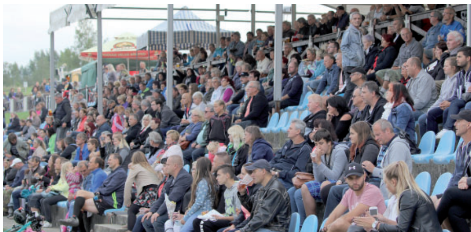
Letošní Den horníků přišly na hipodrom oslavit více než tři tisíce lidí.