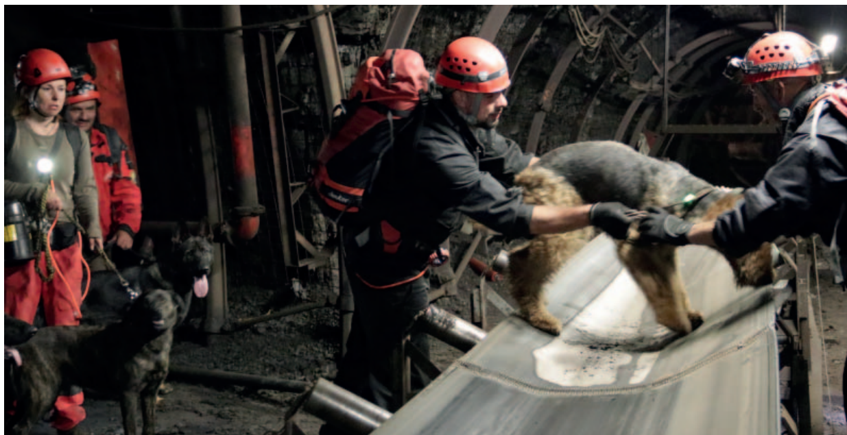
V lomu ČSA kynologové se záchranářskými psy cvičili v naprosto neobvyklém prostředí.

Pětadvacet psovodů z kynologických brigád ze všech koutů Čech se sjelo do Mostu na každoroční týdenní setkání, které pořádá psí škola Rastava. A aby si záchranářští psi vyzkoušeli i prostředí, na které nejsou zvyklí, vypravili se ke hlubinářům na lokalitu Československá armáda Severní energetické.