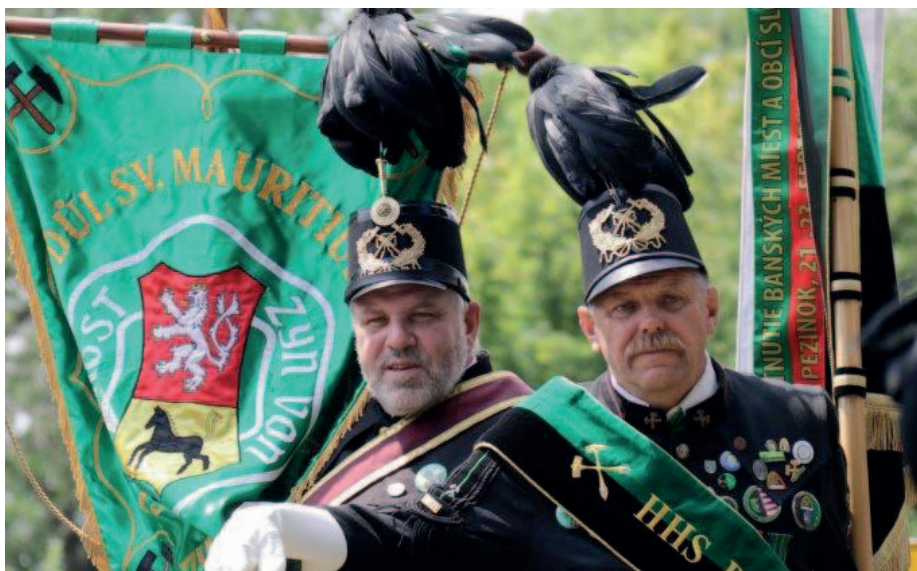
Měděneckého Krušení se pravidelně účastní zástupci hornických spolků z celých Čech. Přijeli i z Abertam. Tamní důl sv. Mauritius je od letoška také na seznamu světového kulturního dědictví UNESCO.