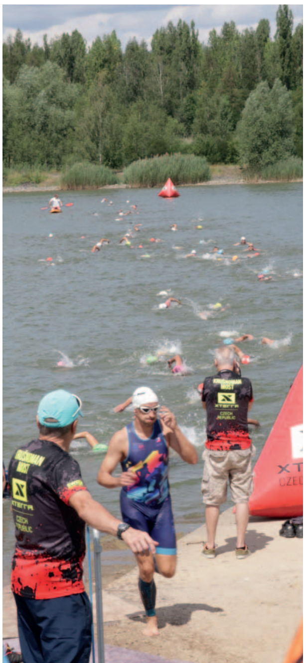
Vodní nádrž Matylda a její okolí se před koncem července staly dějištěm triatlonového závodu Xterra Krušnoman Most. Do hlavního závodu, označeného jako kategorie Original, se přihlásilo více než devadesát závodníků, kteří museli absolvovat 1,2 km plavání, 32 km jízdy na horském kole a deset kilometrů běhu. Svou dávku adrenalinu si mohli vybrat i amatérští závodníci, pro které organizátoři připravili speciální kategorii. Nechyběl ani oblíbený minitriatlon pro nejmenší závodníky. Pořádající litvínovský klub Krušnoman podpořila také Severní energetická.

Přesně dvacet let uplynulo 30. června od zániku samostatného Dolu Jan Šverma. Nejen toto výročí si budou připomínat bývalí zaměstnanci a kolegové na svém pravidelném setkání ve Strupčicích. Letoštní sraz se uskuteční v pátek 6. září ve strupčickém sportovním areálu. (red)