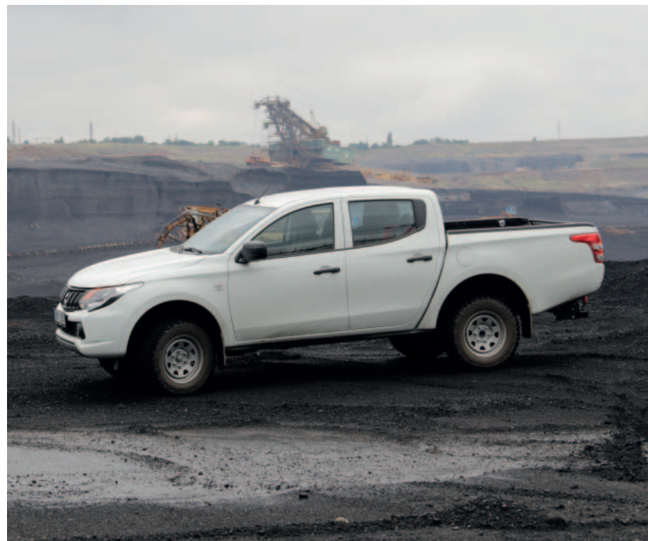
Mitsubishi L200 si zatím v těžebních společnostech skupiny Sev.en Energy vysloužilo jen chválu.

Ze srovnání technických údajů vozidel Mitsubishi L 200 a Ford Ranger vyplývá, že japonský automobil je se svými 1 945 kilogramy o více než 200 kilogramů lehčí a motor o objemu 2,4 litru má o 17 kW vyšší výkon, rozvor je kratší o 22 centimetrů. Tyto parametry potvrzují, že by měla mít L200 slušné jízdní vlastnosti nejen na silnici, ale i v terénu. „Do našich podmínek jsou nové vozy vybavovány většími koly s terénním vzorkem, sa-