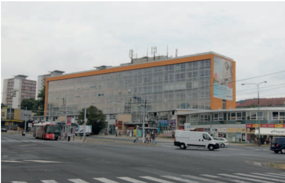
Poradna sídlí v budově Business Centra (bývalých Báňských staveb) na mostecké třídě Budovatelů.

Poradna poskytne zájemcům o oddlužení veškerý servis. Podle nové legislativy je takzvanou akreditovanou osobou, která může podávat návrh na oddlužení, takže její služby jsou opravdu komplexní. „Stačí nás telefonicky kontakto-