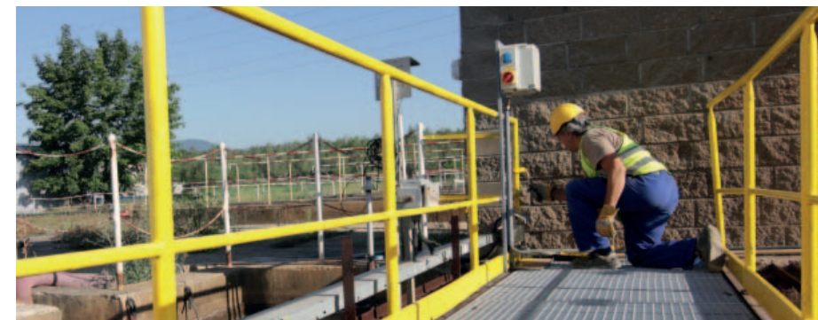
V úpravně důlních vod ČSA dochází v letních měsících k údržbě kalového hospodářství.

Uprostřed prázdnin obvykle vrcholí suché období, kterého úsek odvodnění Severní energetické využívá k údržbě čerpacích stanic. Protože nejsou v provozu, dají se dělat nezbytné opravy a nátěry. Suché letní období je ideální i pro čištění jímek od nánosů nečistot. Na sklonku července sací vodní bagr čistil jednu z usazovacích jímek na úpravně důlních vod ČSA. Na stejném místě probíhá i generální oprava druhého shrabovacího mostu a další činnosti v rámci údržby kalového hospodářství. Stavební práce byly zahájeny také v betonových nádržích čističky odpadních vod ČSA.