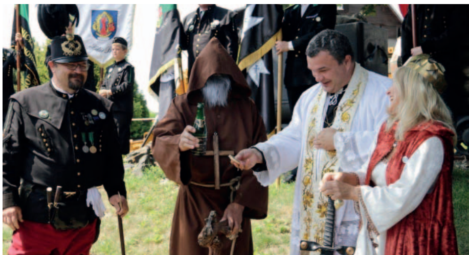
Měděnec vydal nové turistické známky. Pokřtil je farář spolu s hornickými patrony svatým Prokopem a svatou Barbarou.

Sedmé Měděnecké Krušení bylo letos o něco slavnostnější. Oslavovalo se zároveň zapsání krušnohorských památek na seznam světového kulturního dědictví UNESCO. Na sever Čech se sjeli zástupci českých hornických spolků, kteří v průvodu prošli obcí, aby společně u informačního centra zavzpomínali na kolegy, kteří se slavnostního okamžiku nedožili. V rámci doprovodného programu si zájemci mohli prohlédnout záchranářskou techniku, včetně vybavení mosteckých báňských záchranářů. Oslavy zakončila večerní zábava.