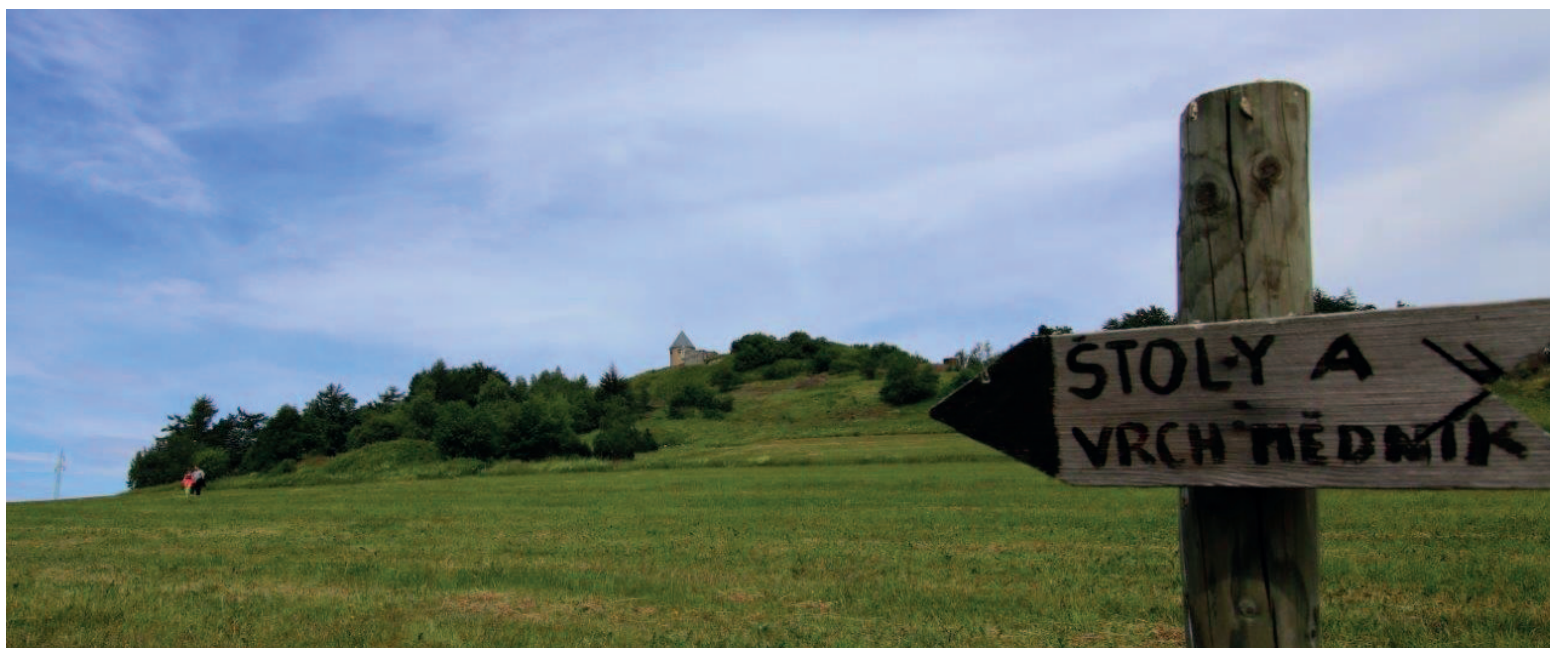
Kaple Neposkrvněného početí Panny Marie stojí na vrchu Mědňník už od 17. století. I ona patří do seznamu UNESCO. Místní by ji chtěli oživit a více přiblížit veřejnosti.