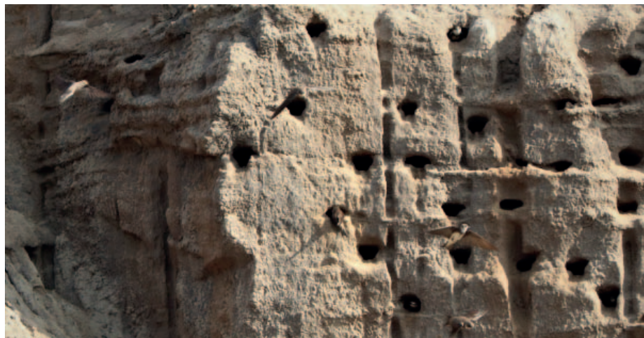
Z dálky to vypadá jen jako spousta děr v jedné ze stěn povrchového lomu, zblízka jsou to ale hnízda břehulí.

Břehule říční (Riparia riparia) je drobný vlaštovkovitý pták blíže příbuzný známější a hojnější jirčičkám a vlaštovkám. Na rozdíl od nich si nestaví hnízda z hlíny, ale hrabe si nory především v písčité stěnách. A právě tehle jejich zvyk je nejvíc ohrožuje, protože vhodné stěny z přírody velmi rychle mizí. V minulosti břehule hnízdily především ve stěnách břehů řek, jenže neregulované řeky jsou už minulostí, a tak se ptáci přesunuli do nejrůznějších těžebních lokalit. Podobně jako vlaštovky a jirčičky se živí hmyzem, kterého v zemědělské krajině také rychle ubývá a i to může být příčinou poklesu jejich výskytu v některých oblastech. Na zimu, kdy je u nás hmyzu velmi málo, břehule odlétají do subsaharské Afriky. Cesta je to náročná, Sahara se neustále rozšiřuje, lidská populace v Africe raketově narůstá a s ní mizí i přírodní stanoviště pro ptáky. „A když se připočte i velmi vrtkavé počasí v po-