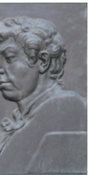
Náhrobní busta Ferdinanda Maxmiliána Brokoffa v Praze.

na Karlově mostě. Brokoffovi je připisováno autorství či spoluautorství devíti z nich. Na jedné plastice zřejmě najdeme i sochařův autotyp – mladíka s knihou na sousedě sv. Františka Xaverského. Je však třeba podotknout, že sochy na mostě jsou většinou kopiemi, originály jsou uloženy v Lapidáriu Národního muzea. Další sochy Ferdinanda Maxmiliána jsou rozmístěny po celé Praze, na Hradčanech, Malé Straně a ve Starém Městě. My ale za Brokoffem nemusíme cestovat do Prahy. Z dílny rodiny Brokoffů pochází písčivá plastika živlů – Země, Vzduchu, Vody a Ohně, které původně zdobily renesanční radnici na I. náměstí starého Mostu. Od té doby se sochy několikrát stěhovaly a dnes si je můžete prohlédnout u mosteckého magistrátu. Vznikaly v letech 1715 až 1718, což je rok smrti otce Jana, je pravděpodobné, že na sochách pra-