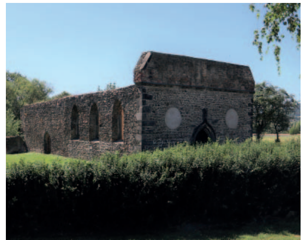
Z hornického kostela svatého Prokopa v Krupce zbylo do dneška pouze torzo.

po přestavbě roku 1676, veřejnosti přestal sloužit v roce 1891. Veškeré jeho vnitřní vybavení vzalo za své při požáru v roce 1939, částečnou rekonstrukcí torzo kostela prošlo v polovině devadesátých let. Podobu hornického patrona připomínají dvě sochy přímo v Mostě. První z roku 1723 pochází od neznámého autora a původně stála v Souši. Na