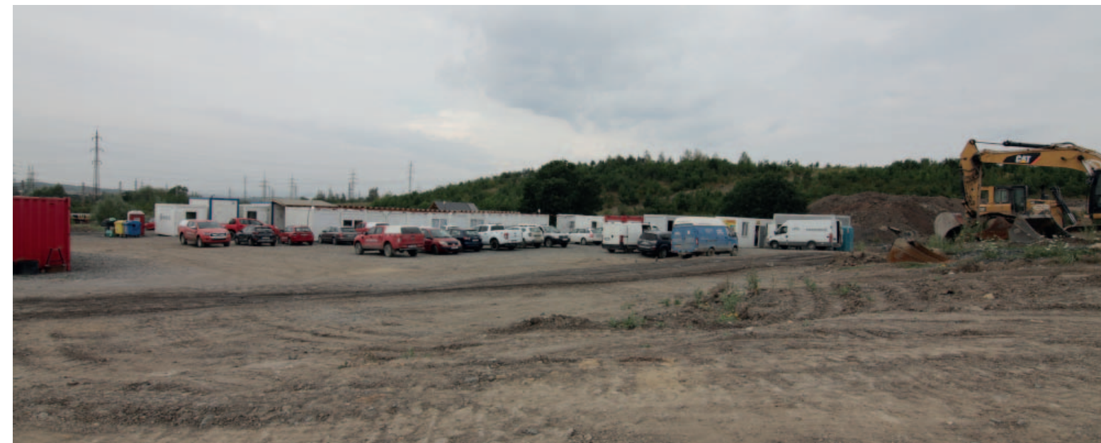
Buňkoviště v Hořanském koridoru je srdcem celé stavby, které ale po jejím dokončení zanikne.

Z dálky toto pracoviště vypadá sice jako početnější, ale stále jen shluk pracovních buněk nebo kontejnerů, jedná se ale o v současné době jedno z nejvytíženějších pracovišť ve Vršanské uhelné. S trochou nadsázky by se dalo říci, že vidíte srdce stavby přeložek v Hořanském koridoru.