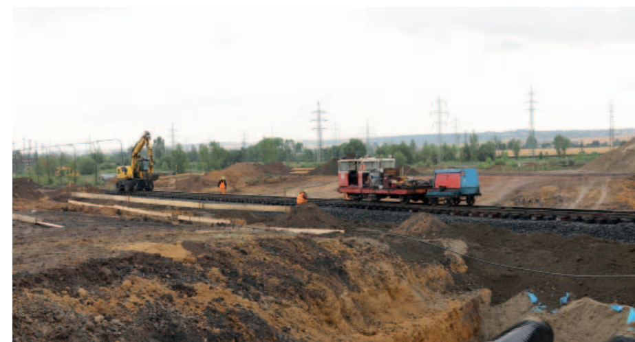
Přes stejné místo už o tři dny později opět vedly koleje.

Po etylbenzenu, jehož přeložka byla úspěšně dokončena letos na jaře, by do konce letošního roku mohly být v nové trase zprovozněny ještě tři linky produktovodů. Další by měla být připravena k přepojení na příští rok. Kompletní přeložení všech inženýrských sítí v Hořanském koridoru se plánuje do konce roku 2021. S přípravou území pro přeložky inženýrských sítí se začalo v roce 2015, v nejbližším místě se posunou o více než kilometr. Přeložky umožní pokračování těžby v lomu Vršany v následujících desetiletích. (pim)