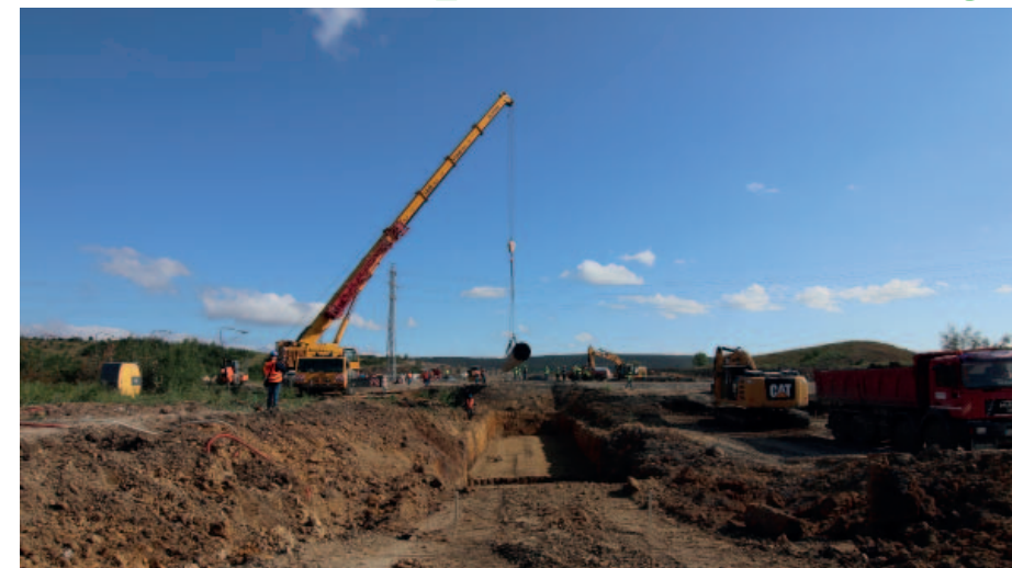
Ve středu 10. července se na místo, kudy obvykle jezdí důlní dráha, pokládalo potrubí.

ně jsme uvažovali o tom, že by práce probíhaly nepřetržitě i v noci, ale vzhledem k tomu, že území bylo potřeba velmi přesně zaměřit a pro důlní měřiče by byla práce v noci problematická, dohodli jsme se, že se bude pracovat pouze ve dne. I přesto se nám všechno podařilo stihnout v termínu od 9. do 12. července,“ uvedl ředitel. Pokud by se práce zdržely, provoz na vlečce by se musel obnovit a stavební firmy by se na místo mohly vrátit až za několik měsíců. Na staveništi se pohybovali zástupci třinácti firem, které