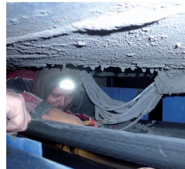
Po odstranění stíracího válečku se podařilo vplížit k místu poruchy.