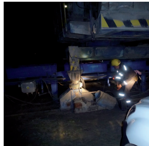
Zaměstnanci elektroprovozu a míchacího centra hledají závadu na kabelu.

Ze složiště stabilizátu (popílek, struska, vápno) hlásí poruchu shazovacího vozu. Venku tma, teplota již na nule. V noci je zařízení mimo provoz, avšak zásobníky popílku v silech signalizují vysoké hladiny. Nestandardní závada se při umělém osvětlení od provozního auta, svítidel a čelovek našla v nepřístupném místě mezi pásovým dopravníkem a shazovacím vozem. Poškozený kabel se podařilo „naspojovat“ bez výměny, která by trvala osm hodin, zařízení zprovoznit a vyjet stabilizát z pásové dopravy. Druhý den složiště funguje a elektrárna vyrábí nepřetržitě nedoceněnou komoditu. Poděkování patří zaměstnancům provozu elektrom. (red)