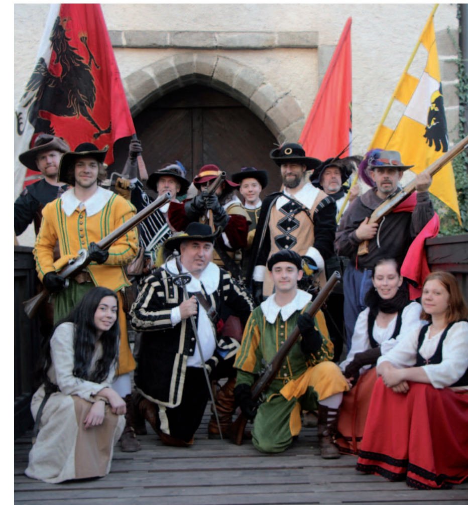
Vítkovci se mimo jiné podílejí na pořádání slavností v Nových Hradech.

hraničí. „Obvykle absolvujeme během sezony kolem desítky akcí. Řadu let jsme se podíleli na přípravách slavností v Postoloprtech. V posledních letech pravidelně spoluprádíme slavností v Nových Hradech. Naposledy jsme se podíleli na přeshraničním projektu a byli organizátory Putování po Vitorazské steze z rakouského města Weitra do Nových Hradů. Vítkovci jsou rovněž členem Euroregionu Krušnohoří, kdy spolupracujeme zejména s partnerským městem Wolkenstein v Sasku. Ze zahraničních štací zajíždíme například do Německa, byli jsme i v Rakousku, Itálii, Lucembursku, Slovinsku a samozřejmě na Slovensku,“ vypočetl mechanik. Základem vystoupení bývají komponované příběhy z různých historických období. S Vítkovci se tak divák může podívat ke starým Slovanům nebo si připomenout gotiku, renesanci či Sedmiletou válku nebo také hraný adventní příběh s betlémskou tematikou. Stylizace do dávno minulých časů je nákladná, a tak si To-