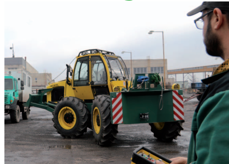
Nový stroj je vybaven i dálkovým ovládáním, což obsluhu v provozu významně usnadňuje práci.

Balík se 150 až 200 metry gumového pásma a o váze několika tun stroj bez problémů dopraví na místo a gumářům pomůže pásmo natáhnout na dopravník bez použití další techniky. „Traktory s navigákem máme tři, nové LKT je ale ze všech našich strojů nejsilnější. Má kloubové usazení, takže se s ním lépe manipuluje v terénu, díky přední radlici si řidič může upravit terén před zahájením prací. Součástí vybavení je i dálkové ovládání, které obsluhu velmi výrazně pomáhá například při prota-