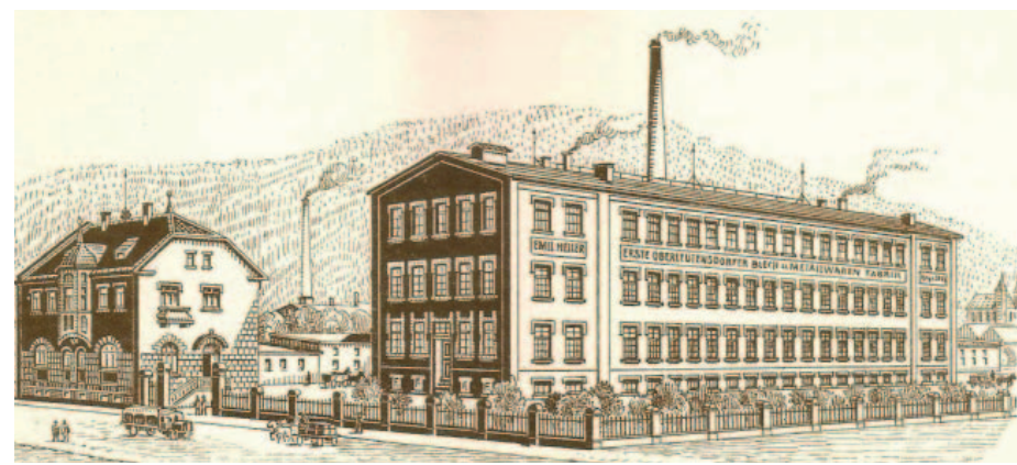
Továrna na výrobu plechových hraček v Litvínově byla zbořena v 60. letech minulého století.