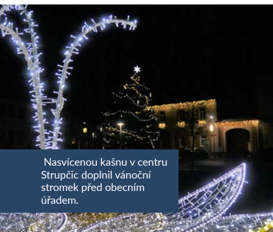
Nasvícenou kašnu v centru Strupčic doplnil vánoční stromek před obecním úřadem.

Snad se nám alespoň tímto způsobem podaří přiblížit čtenářům Sev.en novin neopakovatelnou předvánoční atmosféru a popřát všem hodně štěstí a zdraví do nadcházejícího roku. (red)