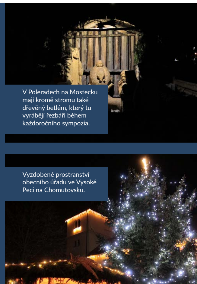
V Poleradech na Mostecku mají kromě stromu také dřevěný betlém, který tu vyrábějí rezbáři během každoročního symposia.