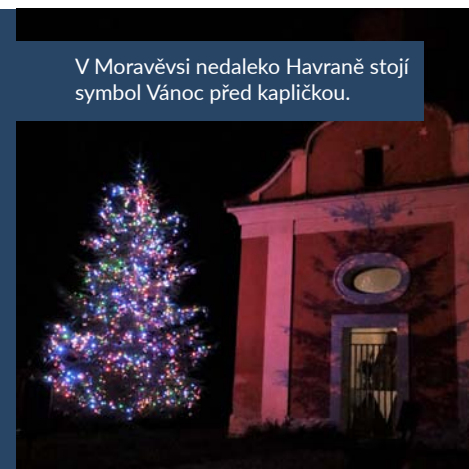
V Moravěsi nedaleko Havraně stojí symbol Vánoc před kapličkou.