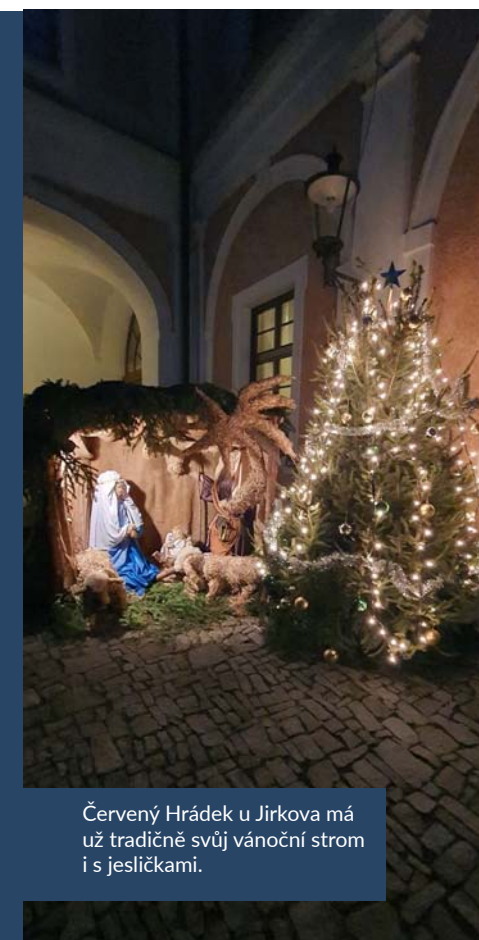
Červený Hrádek u Jirkova má už tradičně svůj vánoční strom i s jesličkami.