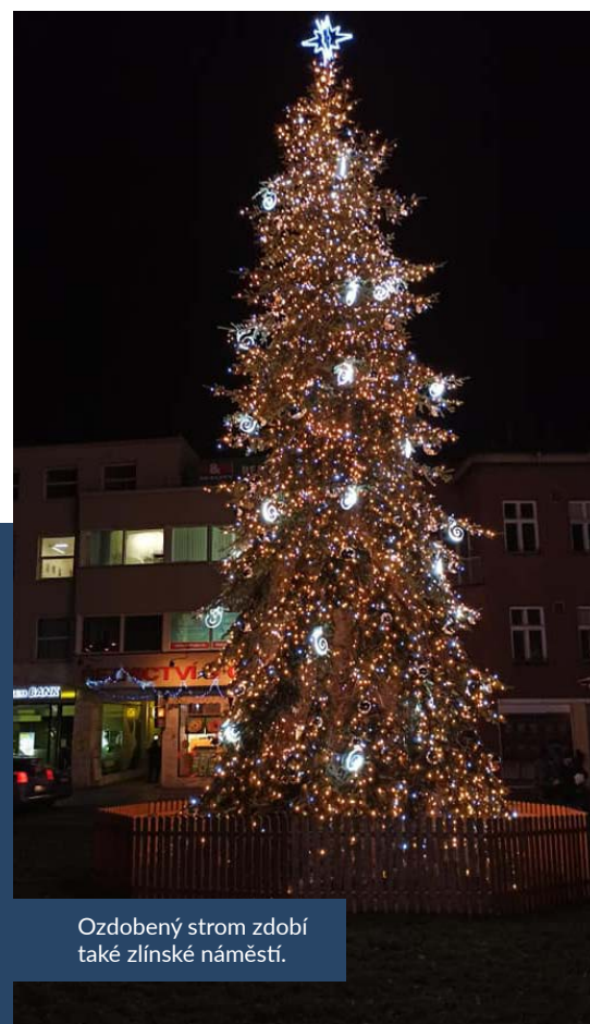
Ozdobený strom zdobí také zlínské náměstí.