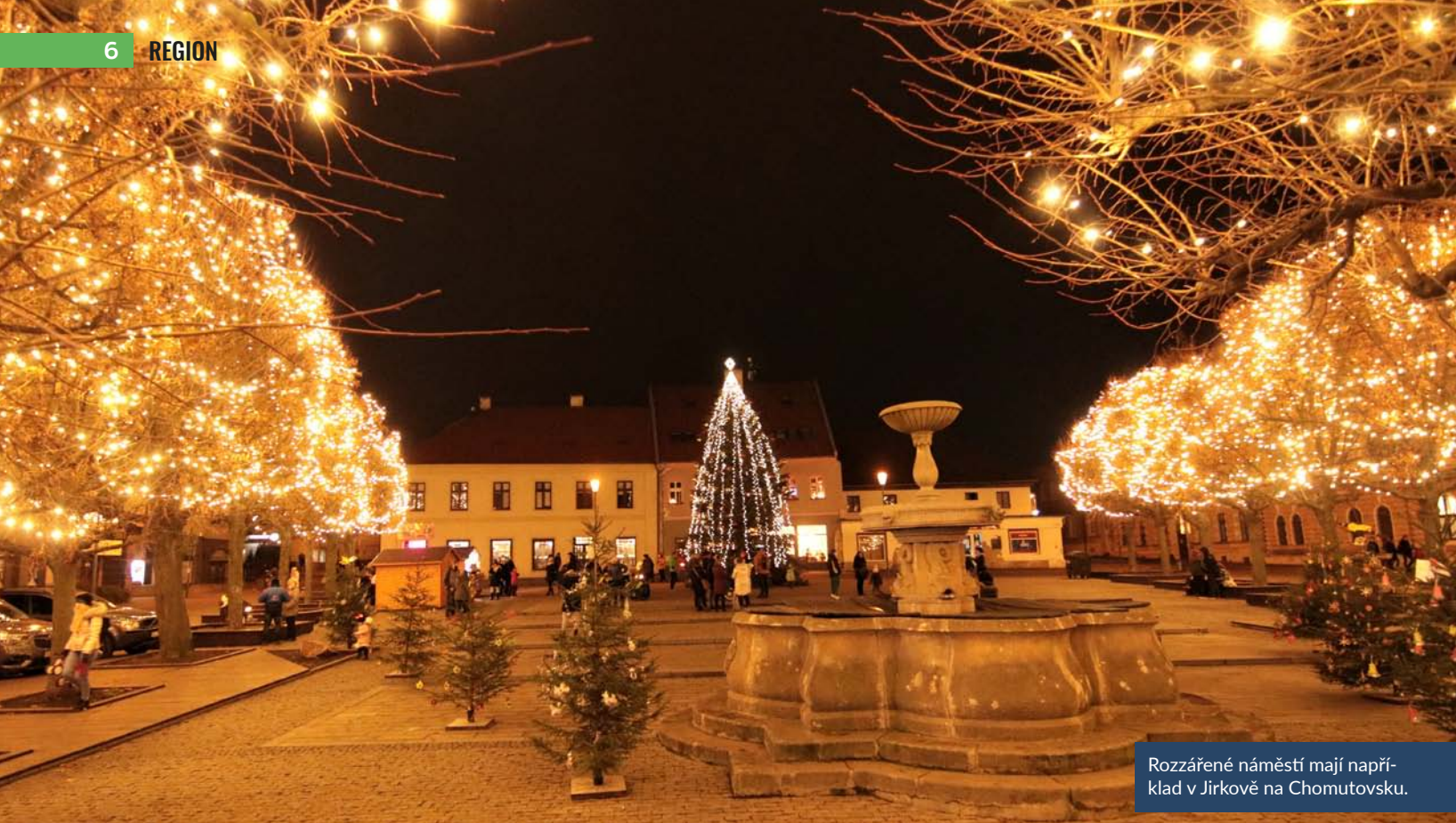
Rozzářené náměstí mají například v Jirkově na Chomutovsku.