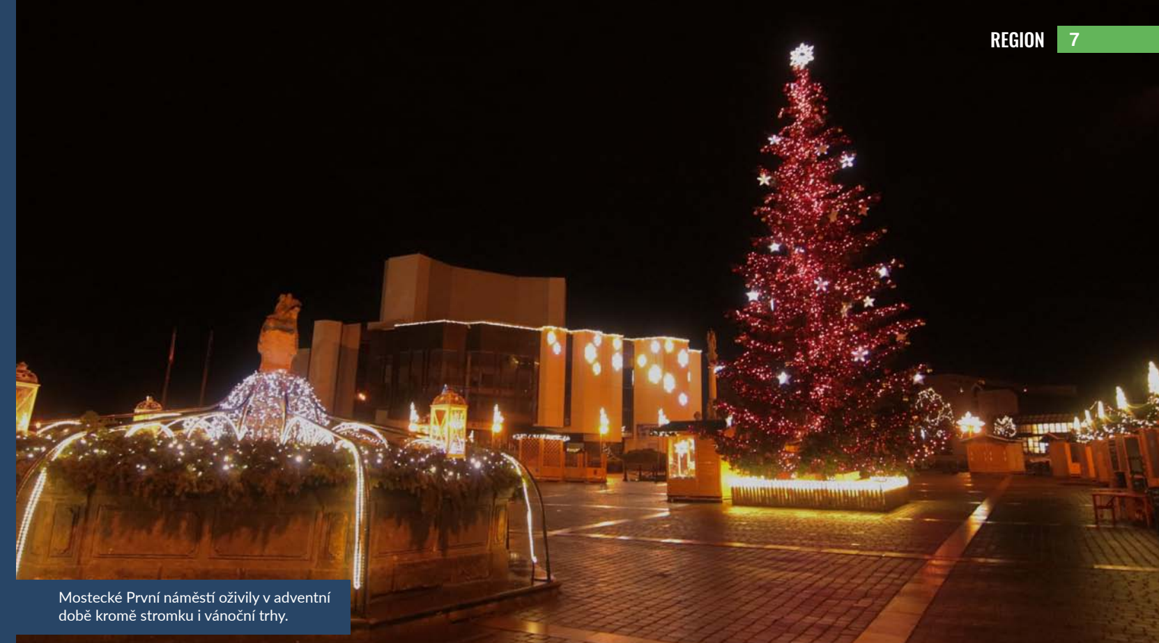
Mostecké První náměstí oživilo v adventní době kromě stromku i vánoční trhy.