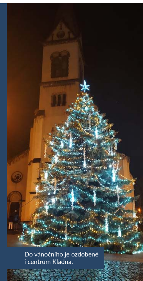
Do vánočního je ozdobené i centrum Kladna.